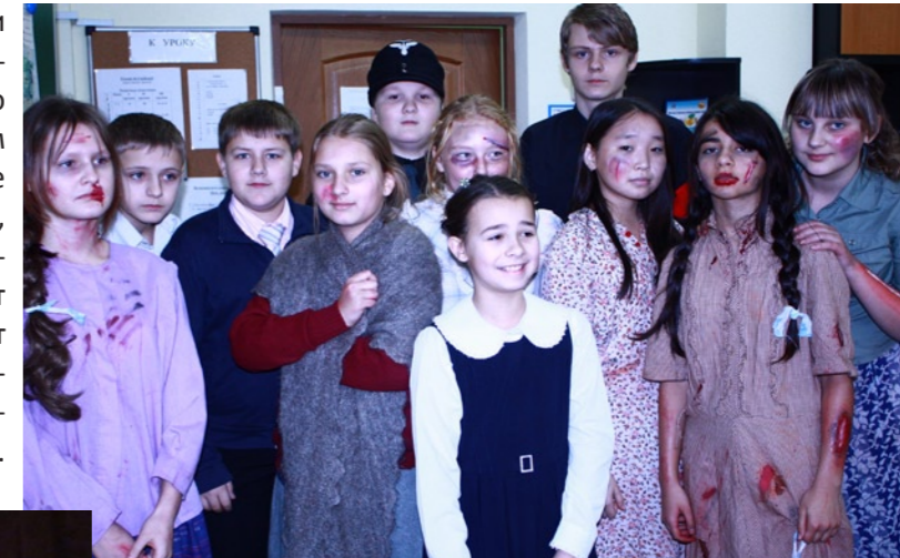
Группа среднего театра — сегодняшние участники спектакля «Молодая гвардия»

— Преподнести людям информацию по моей теме («Геноцид армян»), получить новые знания, опыт.