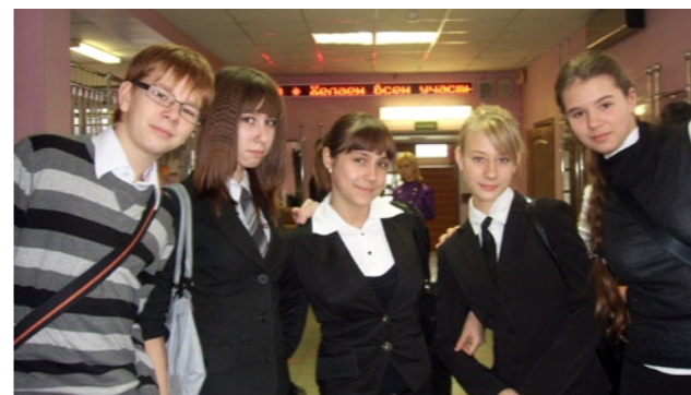
Ребята из ГОУ СОШ № 2033 смотрели видеоролик о нашей гимназии и почувствовали ее творческий настрой. С таким же настроением хотят защищать свои работы в секциях «Психология» и «Культурология»