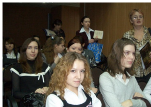
Перед открытием конференции

ежегодно проходит в Московской гимназии № 1504, уверенно доказывает — интеллектуальный потенциал у нации есть! Вот уже в который раз самые пытливые, интересующиеся всем и вся ученики, собираются в нашей гимназии поведать миру и самим себе о том, что они способны к исследовательской деятельности, и свои изыскания в разных областях представляют широкому кругу сверстников и преподавателей.