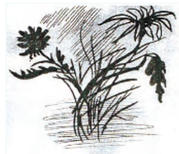
рис. Анны Полинской

Разбудит ветер он крылами, Их только стоит распахнуть... И спустится наш бог за нами, И мира нам расскажет суть.