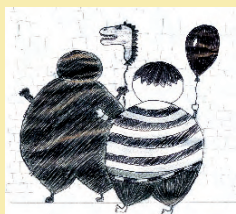
рис. Маши Михеевой 7 «Б»