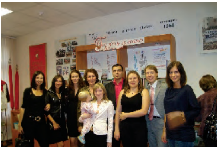
Островок детства и юности...

«Спасибо, — говорит школа-гимназия своим бывшим ученикам, — за то, что вы есть, и за то, что вы не забываете свою альма-матер...»