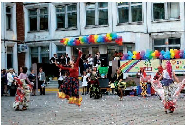
«Цыганский табор» — театр «Энтузиаст» приветствует выпускников. Э-эх, ромалы!

«Уж небо осенью дышало...» Все, отдышалось... На горизонте - подарки, Дед Мороз и каникулы! Но как же много разных интересных событий произошло в нашей гимназии этой осенью! Об этом — на страницах свежего позднего выпускника. А еще продолжается юбилейный год — год 30-летия нашей школы-гимназии, поэтому сегодня вы узнаете много новостей не только о наших выпускниках и любимых педагогах, но и о том, кем стали бывшие пионервожатые и учителя школы № 636... А также приглашаем вас к разговору: чего не должно быть в нашей альма-матер?