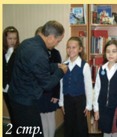
2 стр. Нашего полку прибыло