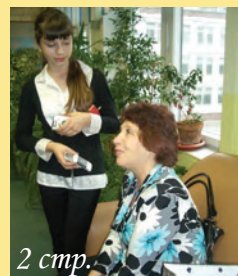
2 стр. Кем стали наши бывшие?