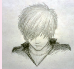
Рисунок Алины Баженовой выпускницы 2010 г.